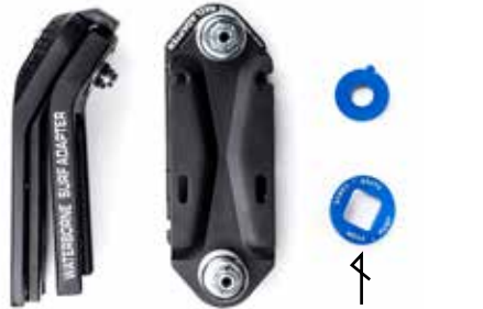
ノーズ側 テール側 フィンシステム