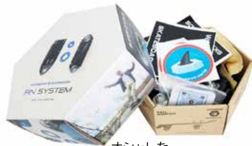
オシャレなパッケージ!