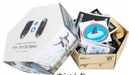
オシャレな パッケージ!