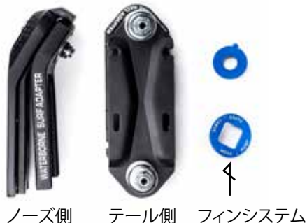
ノーズ側 テール側 フィンシステム